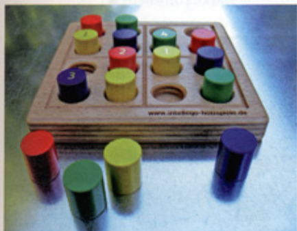
Bereits für Kinder ab fünf Jahren eignet sich «Sudoku Classic Nic», hier in der «Color»-Ausgabe.

Das Unternehmen Intellego Holzspiele aus Gräfenberg, das auf der vergangenen Nürnberger Spielwarenmesse sein einjähriges Bestehen feierte, hat innerhalb seiner «Sudoku»-Reihe neun verschiedene Brettspieltypen im Programm. Die Sets sind hochwertig verarbeitet und bestehen jeweils aus einem Buchebrett sowie Ahornsteinen. «Wir bieten 'Sudoku'-Spielspaß für alle – vom absoluten Anfänger bis hin zum Profi», erklärt Intellego-Firmengründer Alois